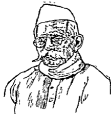
पं० रविशंकर शुक्ल

जीवन के कार्यक्षेत्र में शुक्लजी ने वकील के रूप में प्रवेश किया था। उसी समय उन्होंने सार्वजनिक कार्य में भी दिलचस्पी लेना आरंभ किया। फलस्वरूप सन् १९१४ से १९३३ तक रायपुर की नगरपालिका के सदस्य रहे। इसी बीच सन् १९१५ में राजनीतिक परिपद में गोखले के अनिवार्य शिक्षा-बिल का समर्थन भी किया। शिक्षा और भाषा के प्रश्न पर उनका ध्यान बराबर बना रहता था और तद्विषयक चिन्तन का लाम देश को भी मिला, जब वह १९३७ में मध्यप्रदेश के शिक्षा-मंत्री बने। अपनी सेवाओं और ओजस्वी व्यक्तित्व के कारण शुक्लजी ने तीन बार मुख्य-मंत्री का गौरव प्राप्त किया।